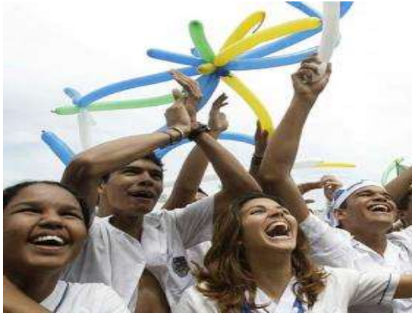
TUJILLO – PERU